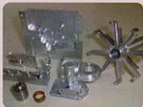
丸材・板材からの削り出し品